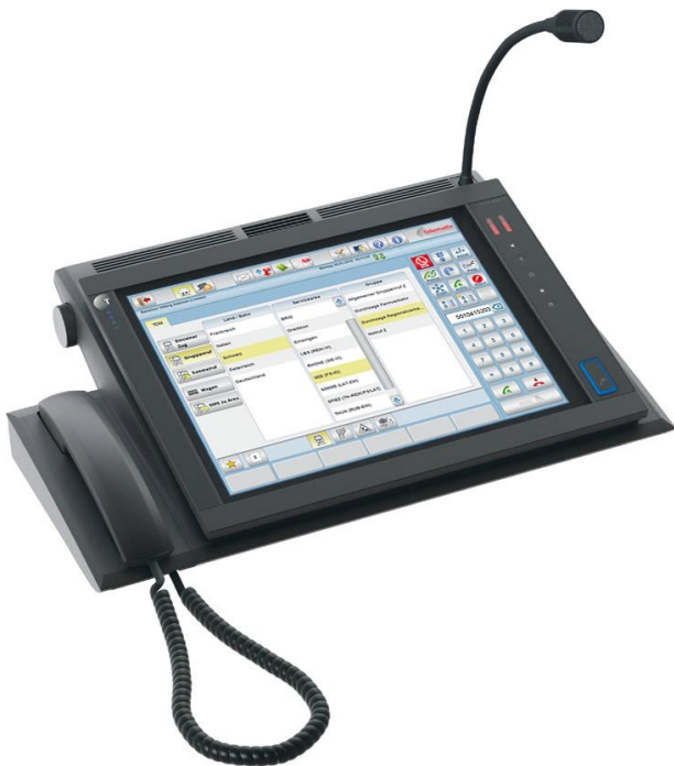
SBG surveycom Bediengerät