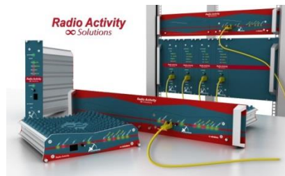
Einbauvarianten der Basis-Stationen

In der heutigen Zeit müssen Investitionen sinnvoll sein. Sie müssen die Bedürfnisse für den Augenblick abdecken, aber auch Erweiterungen sollten möglich sein. Mit der Radio Activity Hardware ist der Investitionsschutz gegeben. Die Kosten fallen erst bei den Erweiterungen vom System an und nicht schon am Anfang bei der Grundausführung.