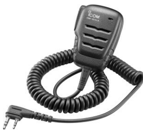
HM-183LS, IP X7